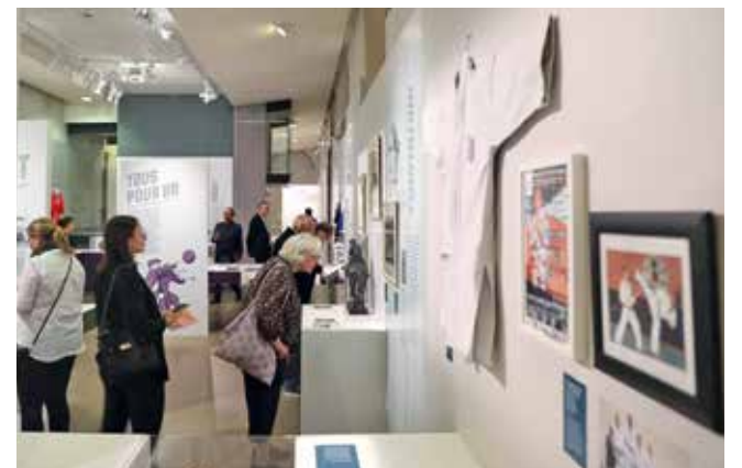
L'exposition Saint-Germain-en-Laye terre de sport , présentée au musée Ducastel-Vera (lire Le JSG 848 ), a été inaugurée le 7 juin.