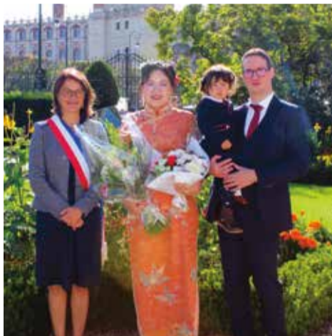
Samedi 28 septembre • Par Priscille Peugnet Guangxia Sun & Jérémie Berenger