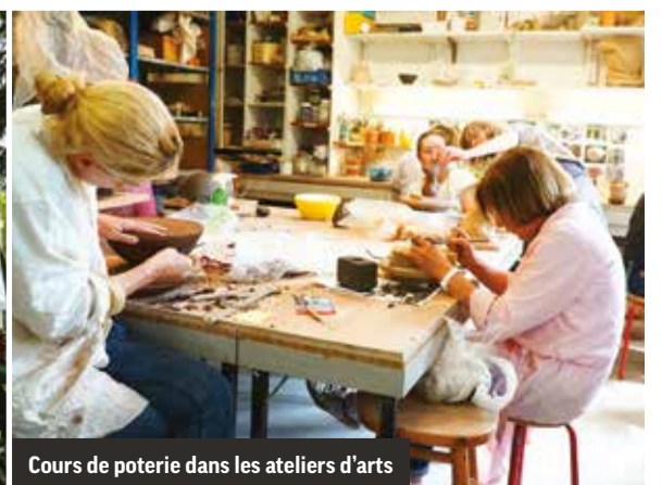
Cours de poterie dans les ateliers d'arts