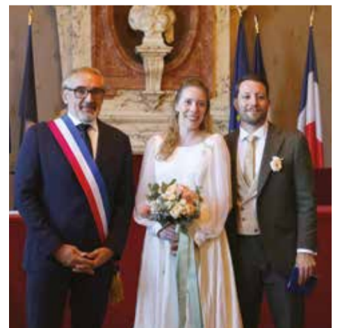
Samedi 5 octobre • Par Arnaud Pericard Marie-Kerguelen Fuchs & Quentin Vicentini