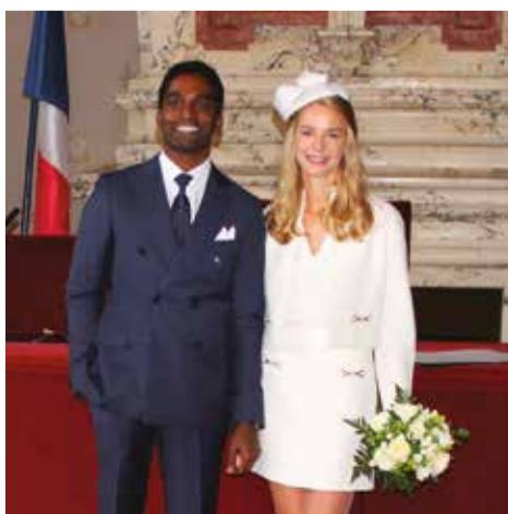
Samedi 2 novembre • Par William Petrovic Olga Siohan & Jérôme Forbin