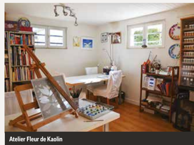
Atelier Fleur de Kaolin