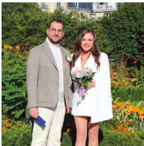
Samedi 5 octobre • Par Benoît Battistelli Alexia Seif el Dahan & Fabien Harb