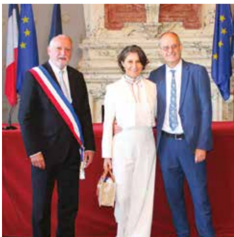
Vendredi 4 octobre • Par Benoît Battistelli Valérie Teychené & Philippe Boscardin