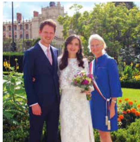
Samedi 28 septembre • Par Sylvie Habert-Dupuis Mûre Maestrati & Félix Thillaye