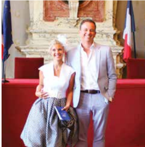
Vendredi 20 septembre • Par Maurice Solignac Laurène Garrigou & Federico Misino