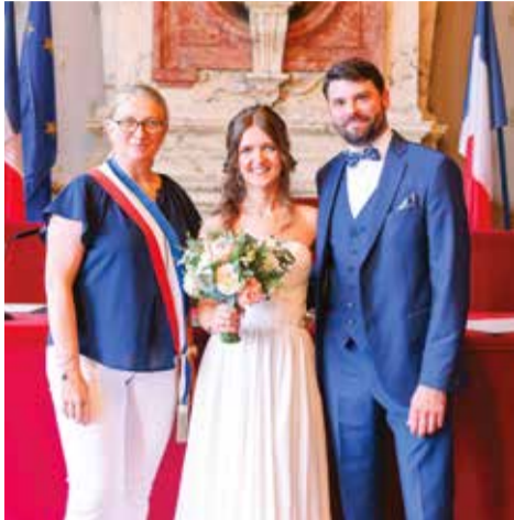
Samedi 7 septembre • Par Marie Aguinet Raphaëlle Grandpierre & Pierre-Alban Bernard