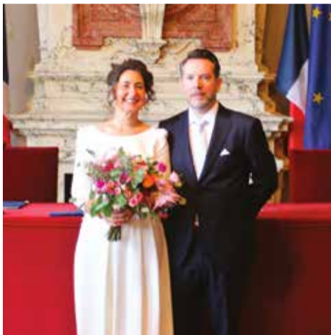
Samedi 21 septembre • Par Maurice Solignac Raphaëlle Widlocher & François Jeannin