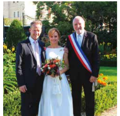
Vendredi 4 octobre • Par Benoît Battistelli Anna Kozlova & Régis Dupont