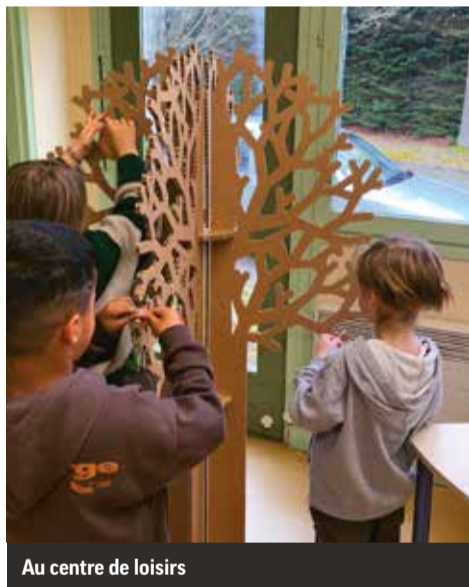
Au centre de loisirs

Parmi les actions développées dans le cadre d'Équilibre, la Ville a proposé aux établissements scolaires de Saint-Germain-en-Laye une boîte à outils permettant d'évoquer ces « éco-émotions » en classe, et qui comprend : un film reportage pour amorcer les dialogues de sensibilisation ; un arbre « éco-émotions » sur lequel, avec des pommes colorées, les élèves accrochent leurs ressentis ; un jeu de société et un livre pour guider les élèves dans l'expression de leurs émotions ; un questionnaire autour de 10 thématiques.