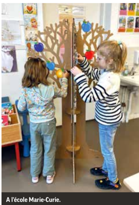
A l'école Marie-Curie.