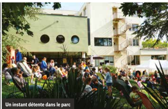
Un instant détente dans le parc