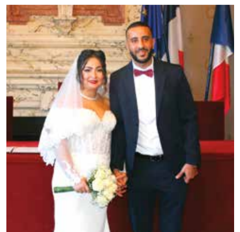
Samedi 7 décembre • Par Marie Aguinet Timila Mokdes & Salim Mrich