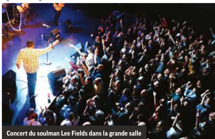
Concert du soulman Lee Fields dans la grande salle