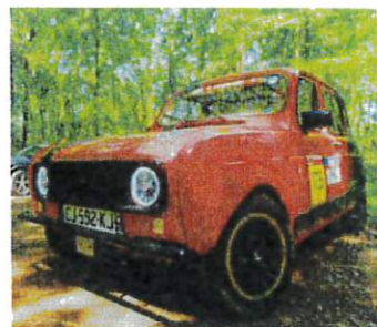
Roues R5 Alpine