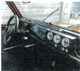
Intérieur high tech